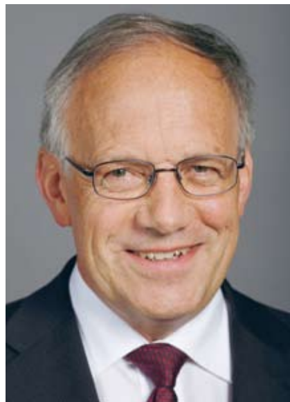
Johann N. Schneider-Ammann*, conseiller national

Outre les emplois, la fin de l'industrie suisse des techniques de défense entraînerait également la disparition d'un précieux savoir-faire. Les produits de la technique de défense se caractérisent en effet par une haute technologie et une excellente qualité. De